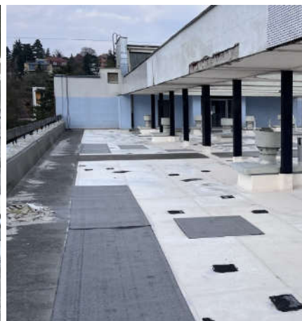
- celkový pohled na střechu